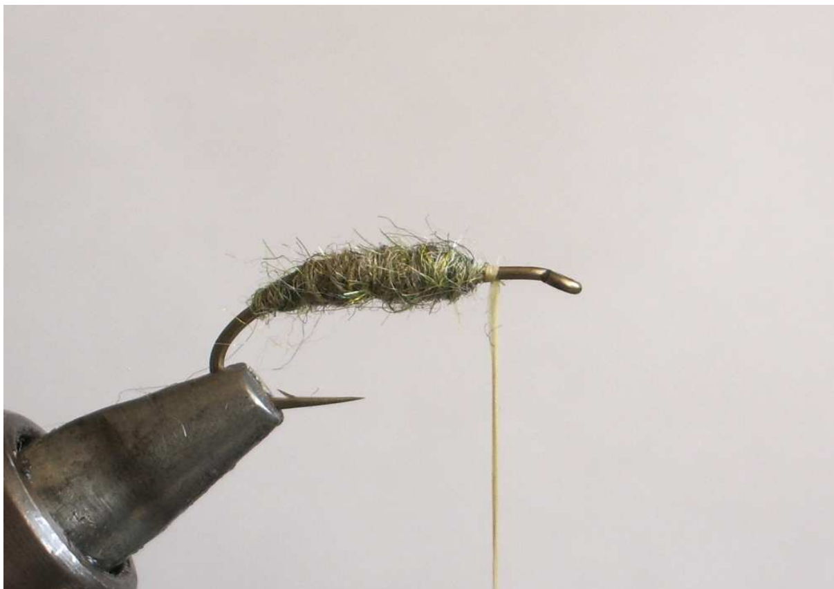
На тази снимка сме използвали Ларва Лейс Дазл дъбинг, микс от 50% кафяв олив и 50% скъд олив