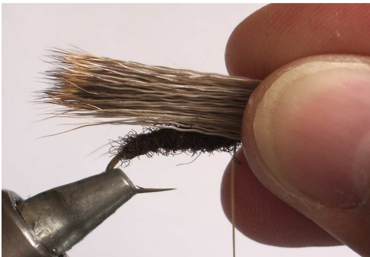
Използвайте подравнител за козина. Дръжте снопа с козината с дясната ръка и изберете правилната дължина на крилото. То трябва да достига 8-10 мм зад тялото. (Не използвайте конец третиран с восък, когато връзвате козина от сърна).