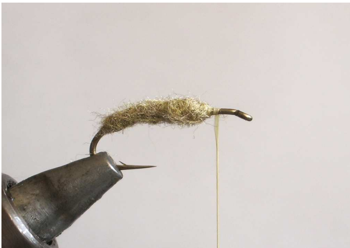
На тази снимка сме използвали Файн енд Драй дъбинг,цвет хексагения