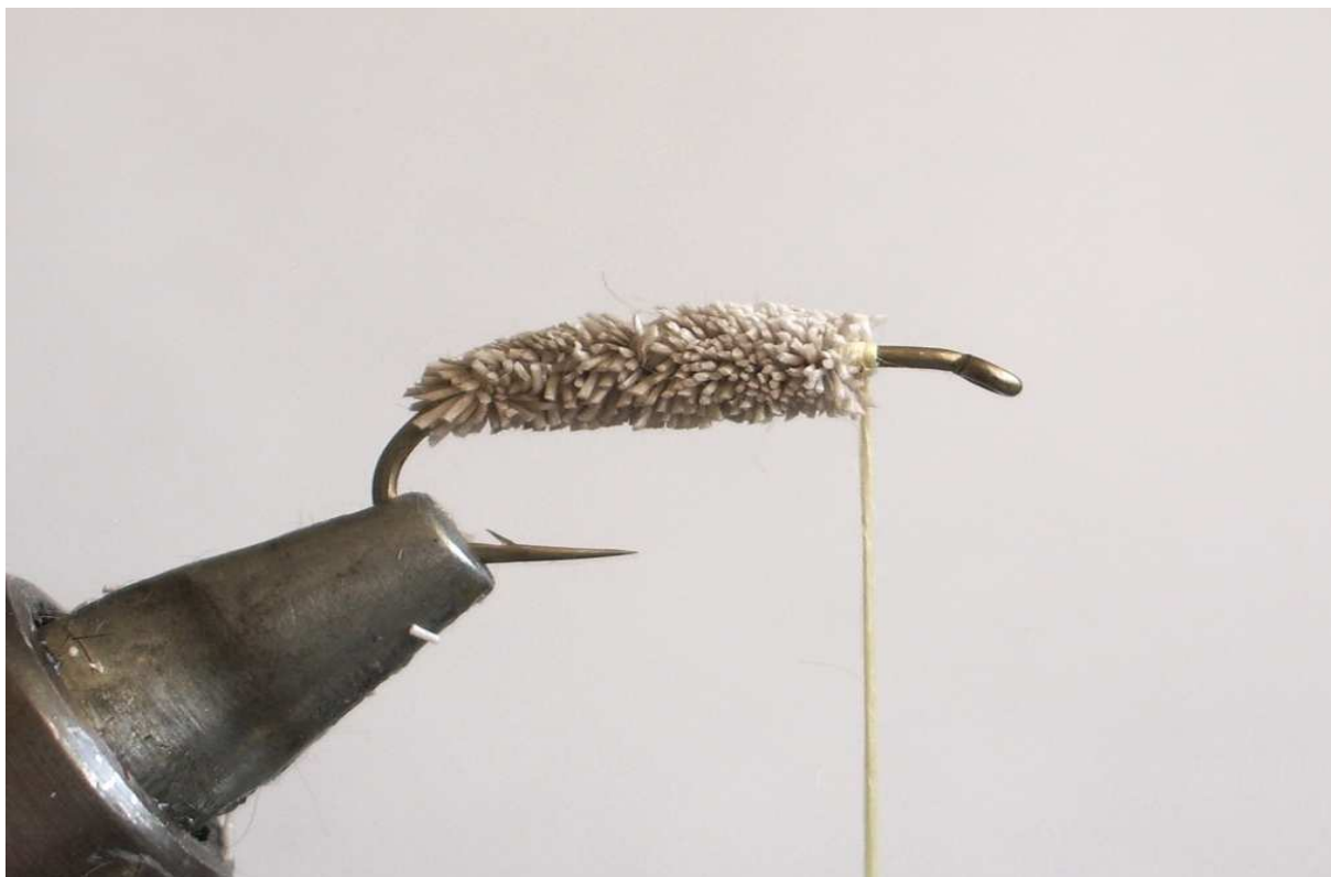
На тази снимка сме използвали козина от норвежка зимна сърна