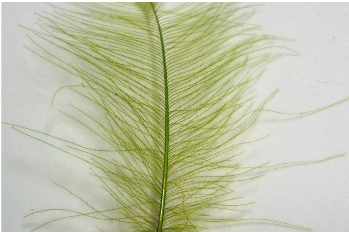
Подгответе CDC перо, като нежно издърпате фибрите с пръсти, така че да сочат на 90^\circ спрямо стеблото.