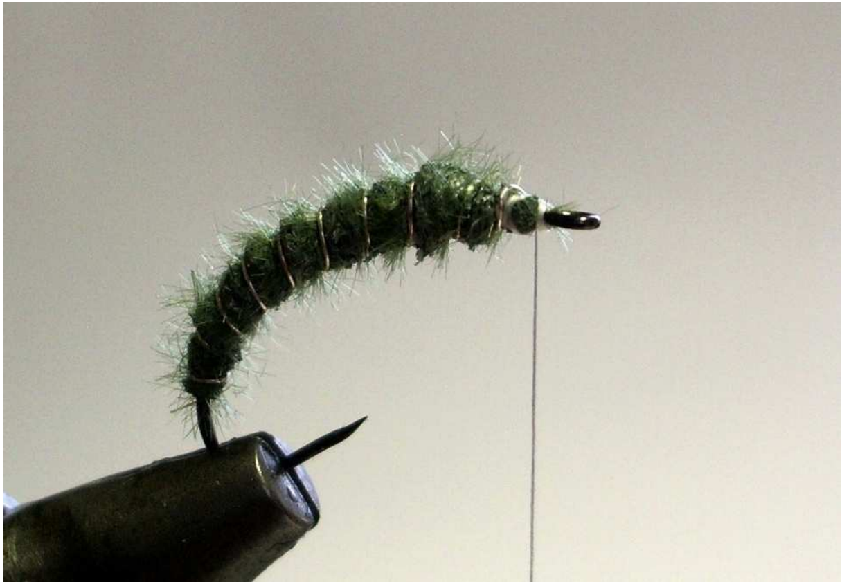
Направете сегменти с рибинга.