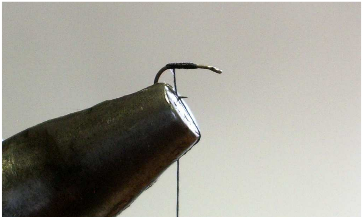
Закрепете конца като започнете 1мм назад от ухото за да се избегне натрупването на материал. Оцветете конца с черен перманентен маркер за да подхожда на цвета на дъбинга